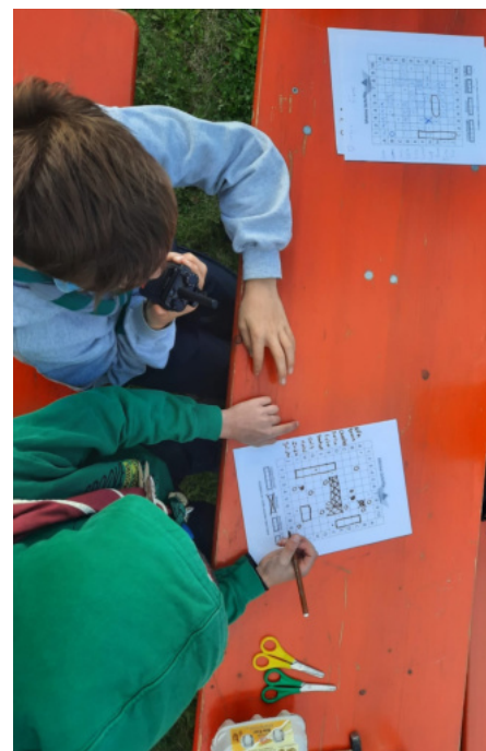
LX3MST Misch -VP SEV